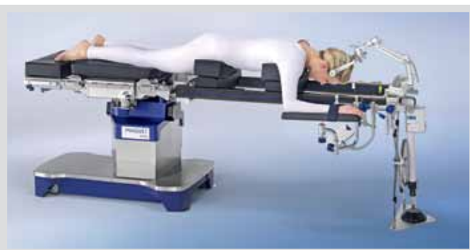
Специализированная приставка для спинальной хирургии