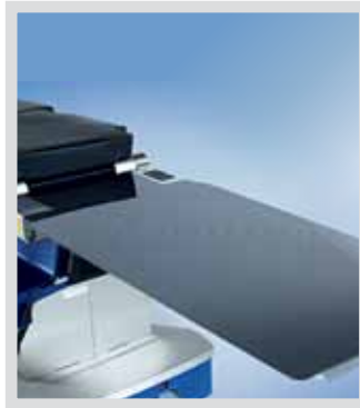
Полностью фиброкарбоновая спинная секция