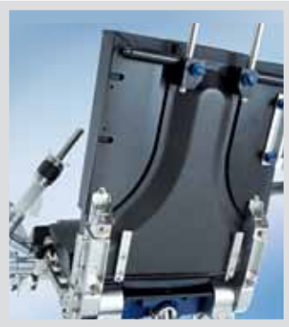
Секция для операций на плече, состоящая из трех частей