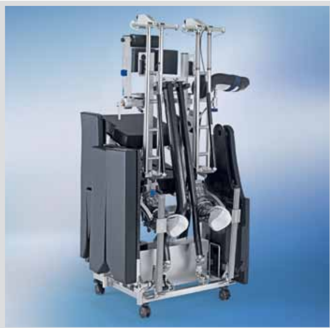
Компактный стенд для хранения всех необходимых принадлежностей и аксессуаров