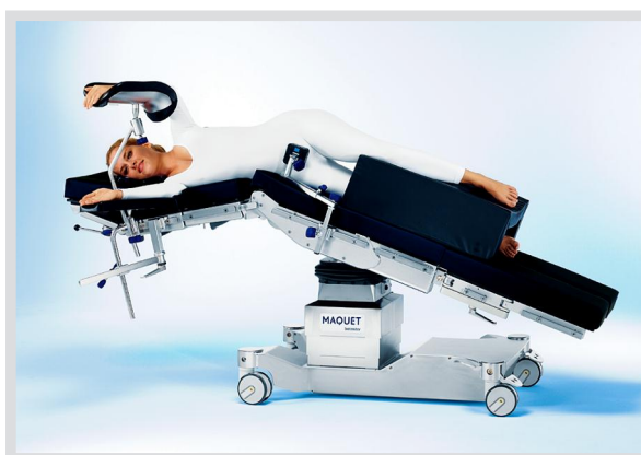
BETASTAR: пример комплектации стола для проведения операций на почке (реверсивная ориентация пациента)