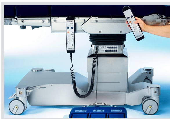
Многообразие элементов управления функциями стола